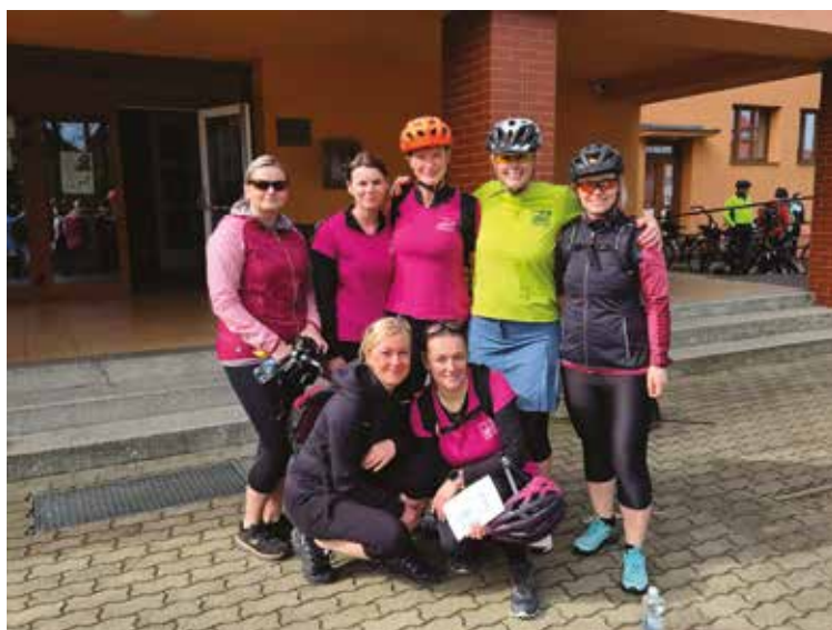
▪ Foto ze startu cyklistického výletu před KD Nechanice.