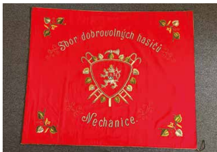
▪ Zrenovovaný hasičský prapor SDH Nechanice.