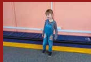
ÚSPĚCHY ŽÁKŮ Z NECHANIC