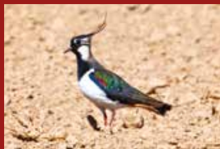
ČEJKA CHOCHOLATÁ V REGIONU