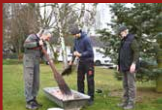
JARO V SADOVÉ

Poznávání přírody v MŠ Stračov... ... čtěte na str. 14