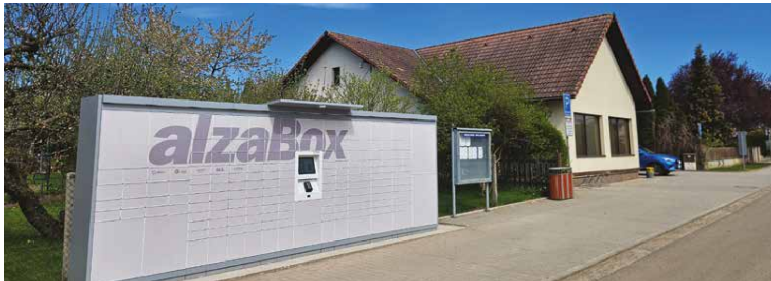
▪ Nová služba nejen pro občany Sadové - Alza box.