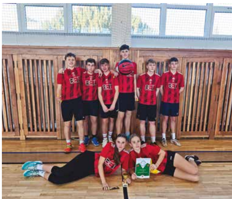
▪ Naši devátáci vybojovali na basketbalovém turnaji 1. místo.

Pozadu nezůstali ani milovníci logiky. Naši žáci se zapojili do populární soutěže Piškorky, kde se jim podařilo