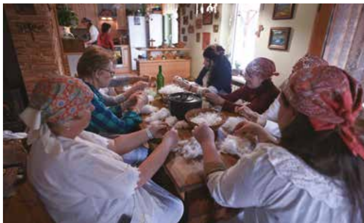
• Draní peří letos již po sedmé