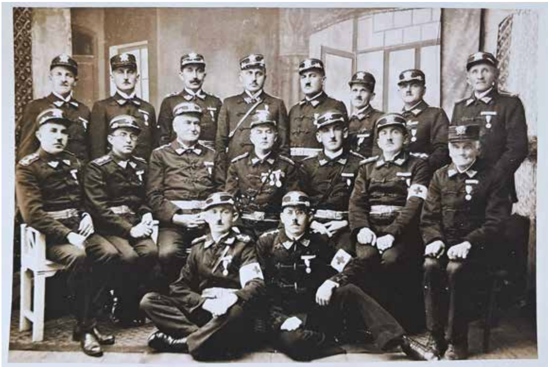
▪ Archivní fotografie výboru Župy Nechanické - rok 1930.