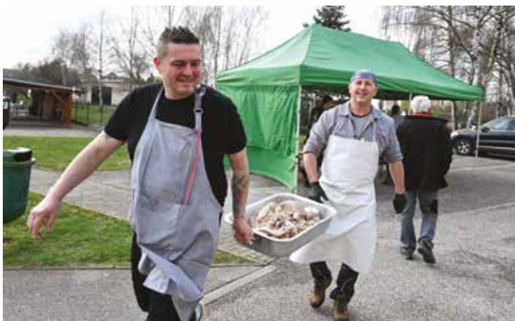
▪ Zabíjačkové hody jsou v Sadové už tradicí.