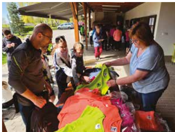
▪ Cílem letošního cyklovýletu byl areál v Sadové.