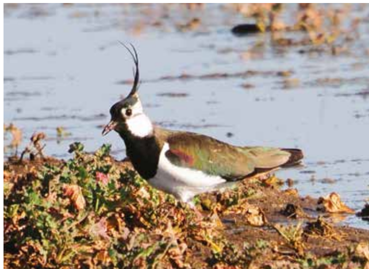
▪ Čejka chocholou – Třesovice 13. 3. 2026.