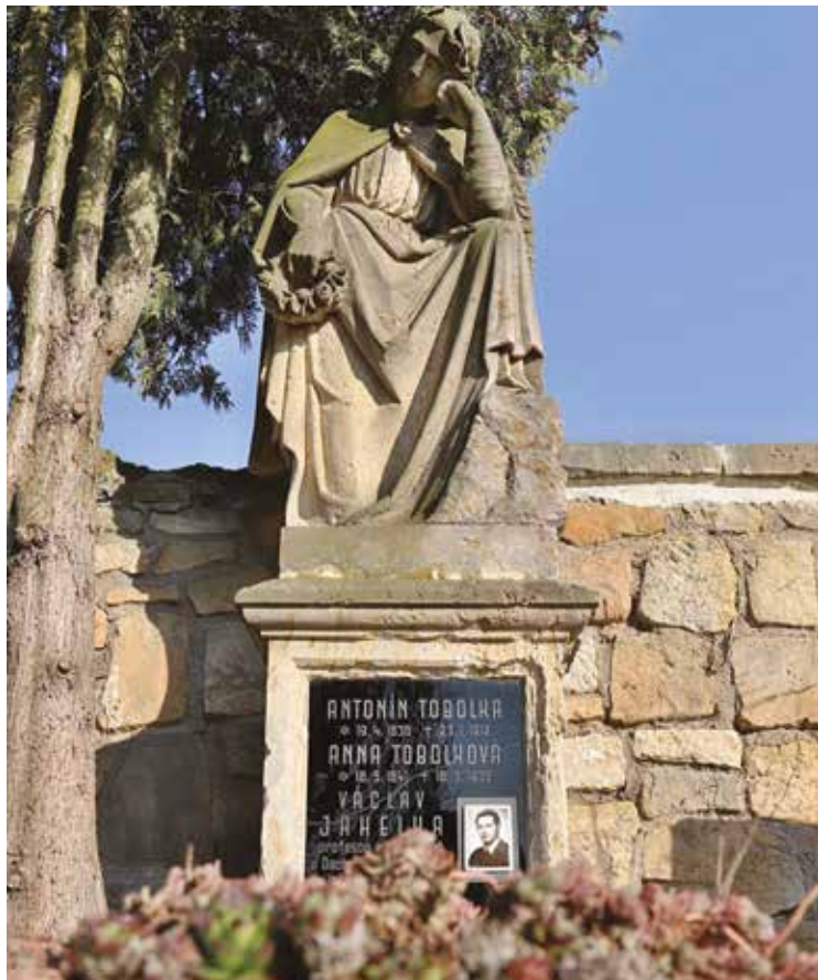
■ Hrob Václava Jahelky.

Na hřbitovech jsou zakončeny různé životní osudy. Na našem dohaličkém začínám odkrývat některé z nich. Jsem však na počátku všech pátrání a ta jsou velmi složitá a časově náročná, proto uvítám od vás čtenářů jakékoli návrhy, připomínky, dobové materiály, fotografie osob, jejichž životní pouť končí na hřbitově na Dohaličkách (využijte prosím e-mail: kviti.hrbitolni@seznam.cz).