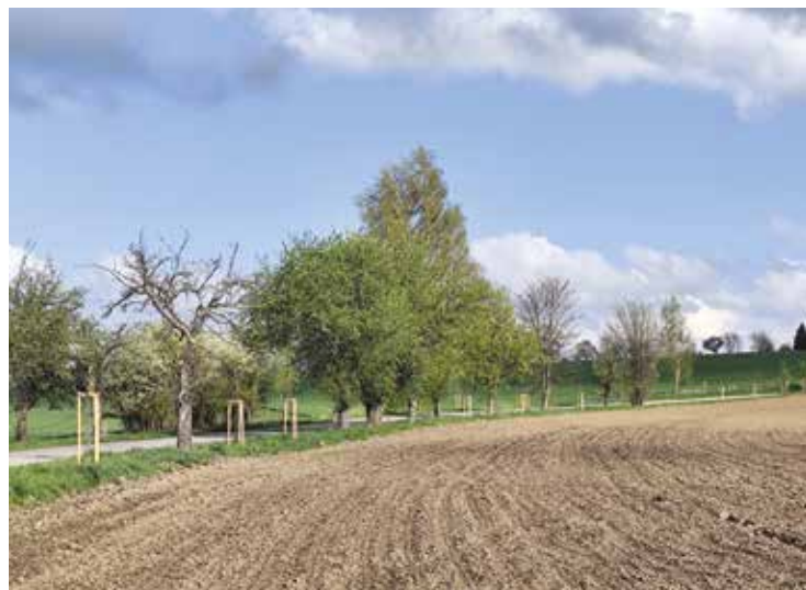
▪ Náhradní výsadba podél komunikace III. třídy Sověťice - Horní Černůtky.

Malá kompenzace pro přírodu, ale lepší než nic. Pro nás to stále nekončí, čeká nás dohled nad opravami využívaného obecního majetku, spolupráce s Královéhradeckým