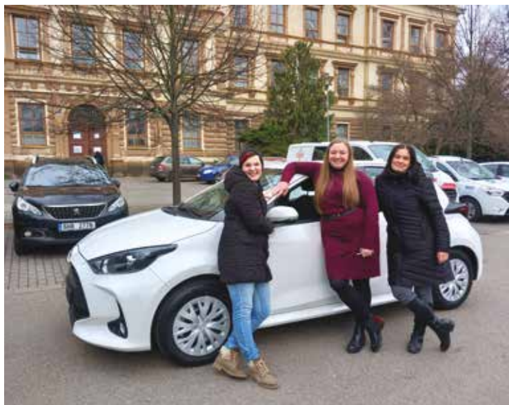
▪ Pracovnice Centra duševního zdraví.