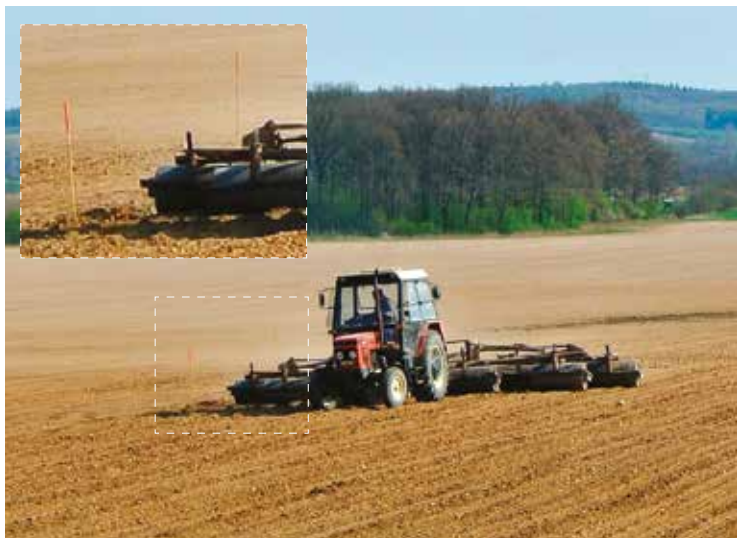
▪ Traktorista objíždí hnízdo čejky při jarní přípravě pole.