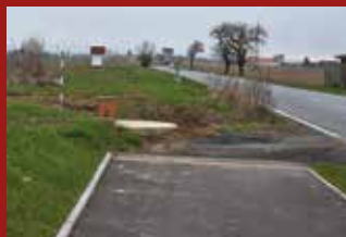
STAVBA CYKLOSTEZKY ZAHÁJENA