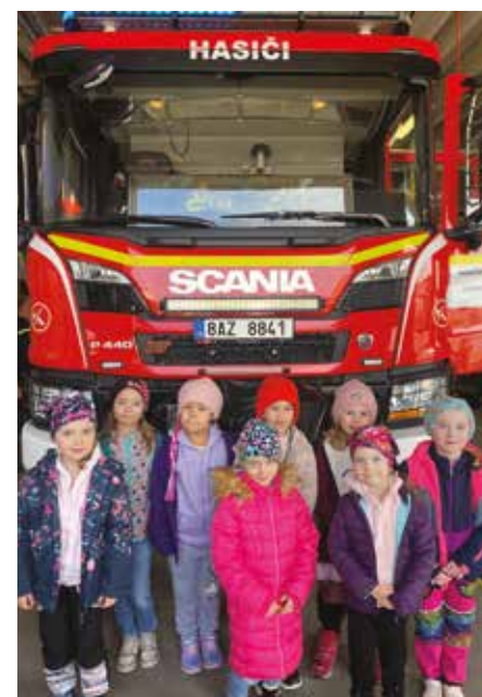
▪ Děti si projektový den u hasičů skvěle užily.