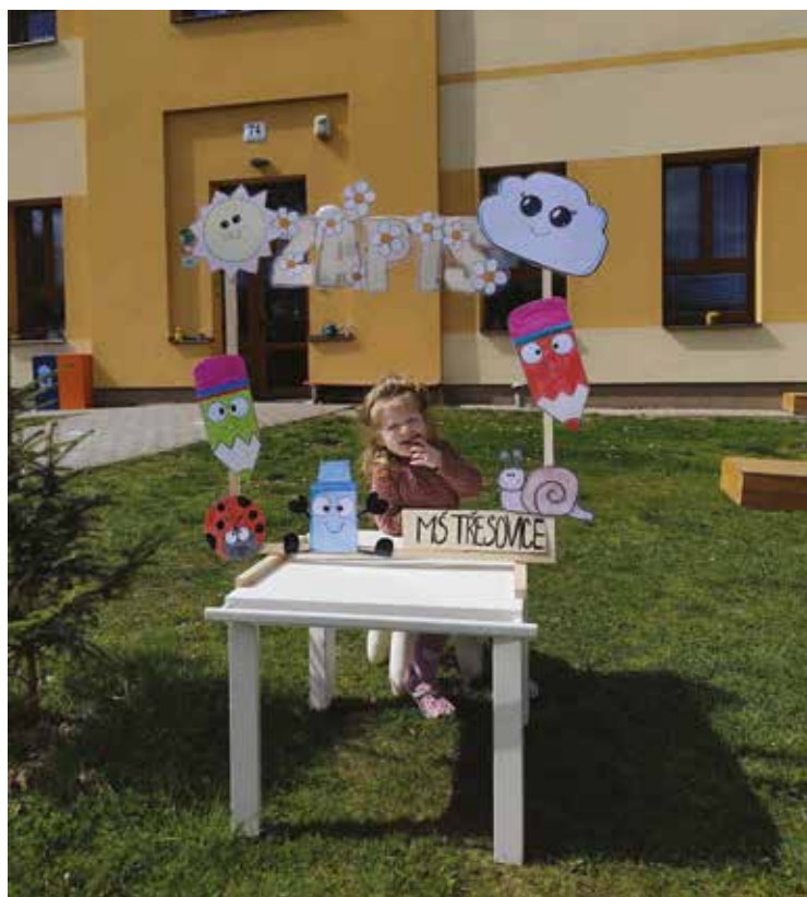
• Nové děti k zápisu vítala nejen vyzdobená školka, ale i zahrada.