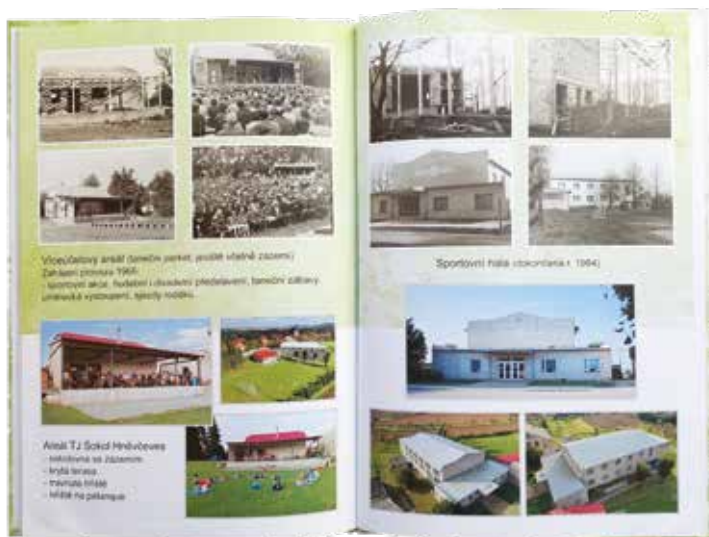
▪ Fotokniha – propojení historie a současnosti na šedesáti stránkách.