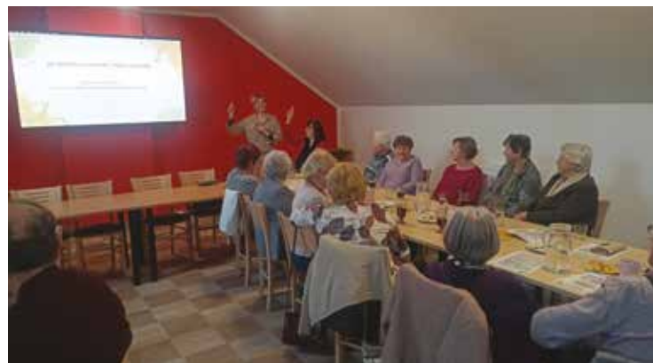
▪ Přednáška byla zaměřená na praktické souvislosti zdraví.