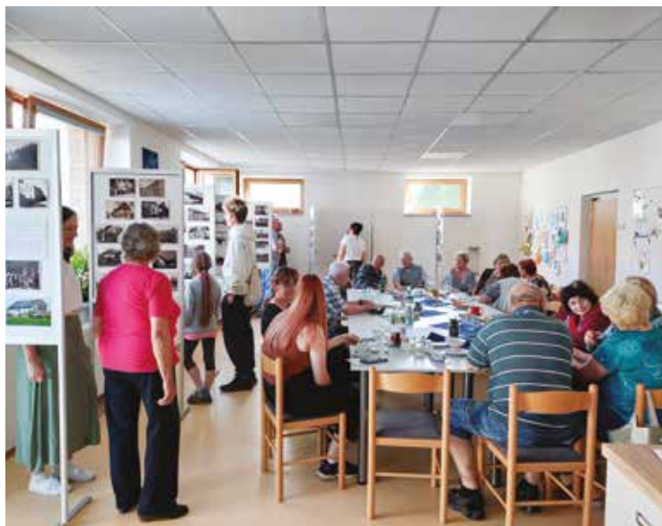
▪ Zpět do historie Hněvčevse – výstava z roku 2024.