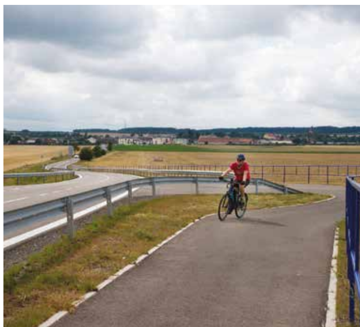
▪ Stěžerská cyklostezka – Dlouho očekávaná stavba cyklostezky bude zahájena v květnu 2026.