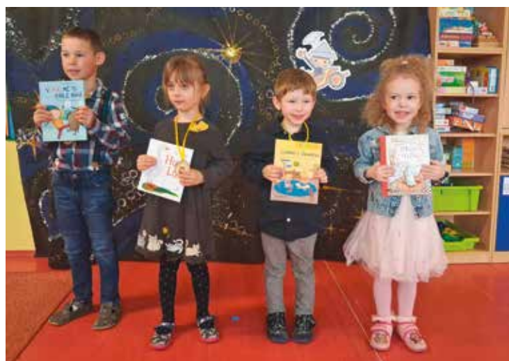
• Vítězové letošního ročníku Stěžerské básničky.