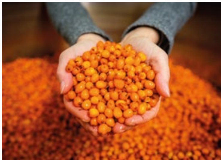
▪ Jedním z regionálních producentů je i firma Rakytník Cvrček ze Lhoty pod Libčany.

Napište nám na mandakova@ic-hk.cz nebo na popkova@ic-hk.cz . Budeme se těšit na spolupráci.