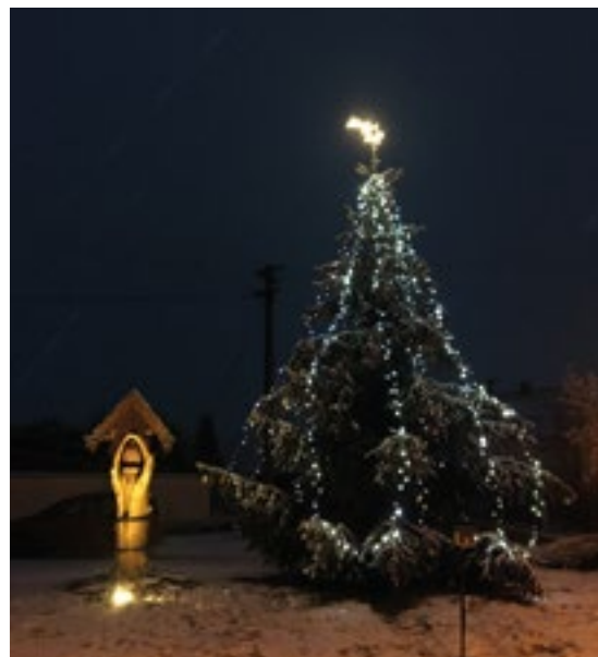
▪ Vánoční stromeček zdobil náves v Lodíně.