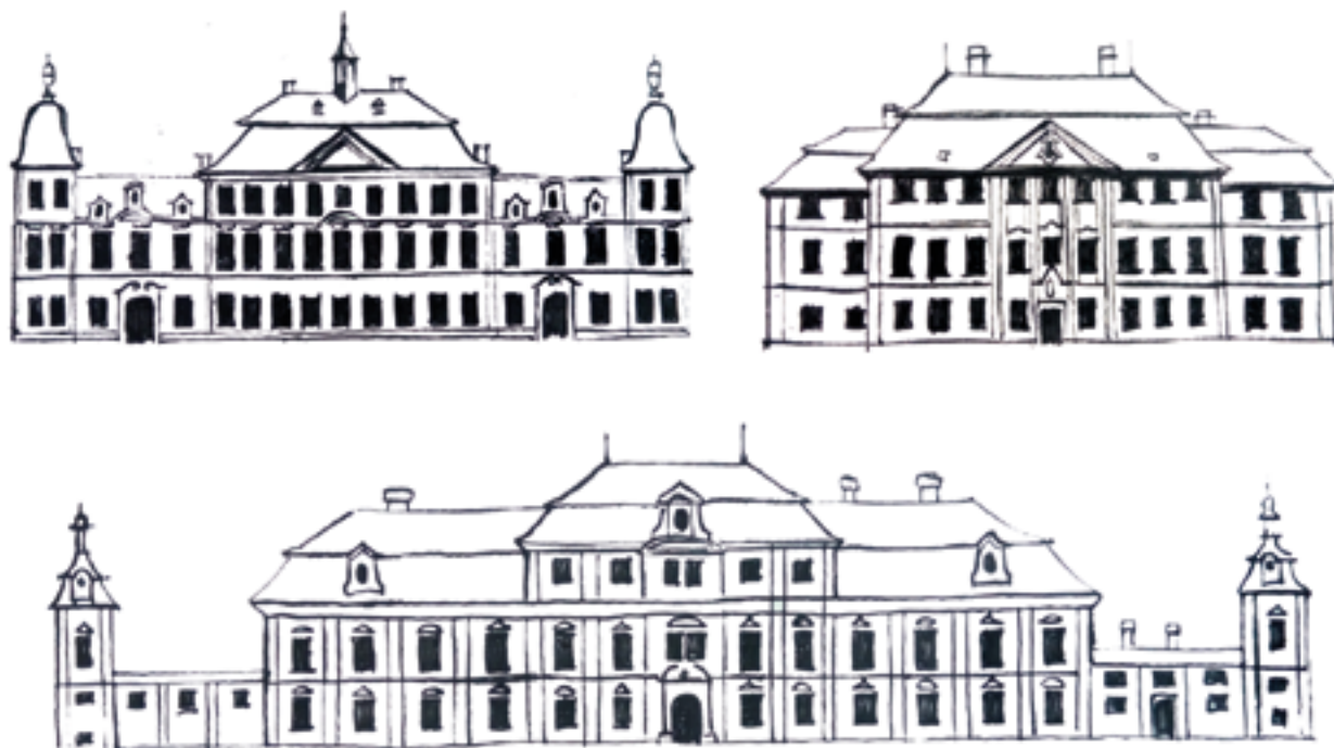
Idealizované vyobrazení zámeckých budov na porovnání vzájemné podobnosti. zámek Sadová (vlevo), zámek Kinských Žďár nad Sázavou (vpravo), zámek Rychnov nad Kněžnou (dole)