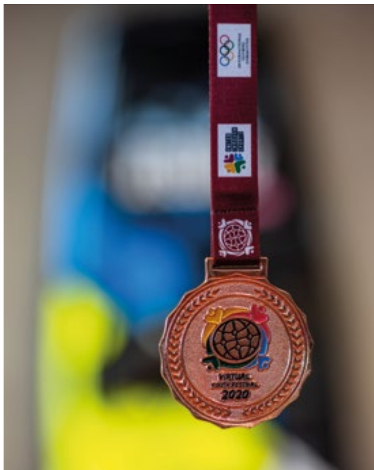
■ Medaile olympionika Matyáše Novotného.