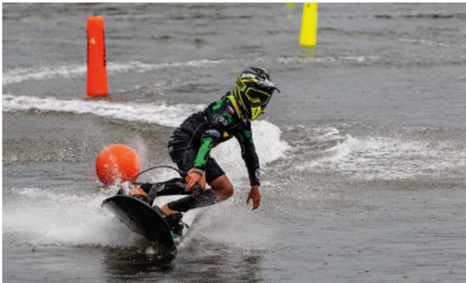
■ Motosurfing – nový sport, který je původem z České republiky.