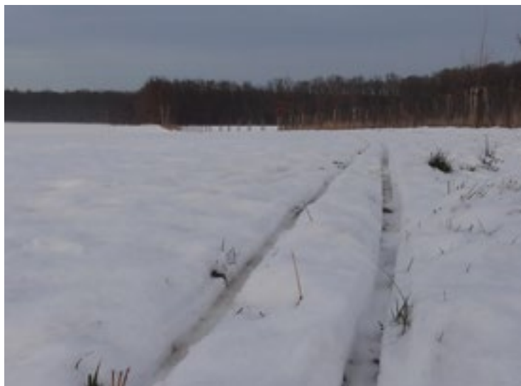
▪ Letošní zima přeje běžkařům.

v nížinách příliš nakloněno. Proto si letos vychutnáváme, že můžeme nasadit běžky hned u dveří domu a vyrazit na bílá pole. Kdo si vyšlapal kopec na Hrádek, mohl si vychutnat báječnou horkou čokoládu přímo u výdejového okýnka hrádeckého zámku.