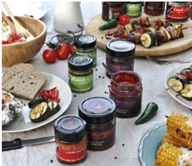
▪ Značkou Regionální produkt se pyšní mimo jiné i firma Hradecké delikatesy.