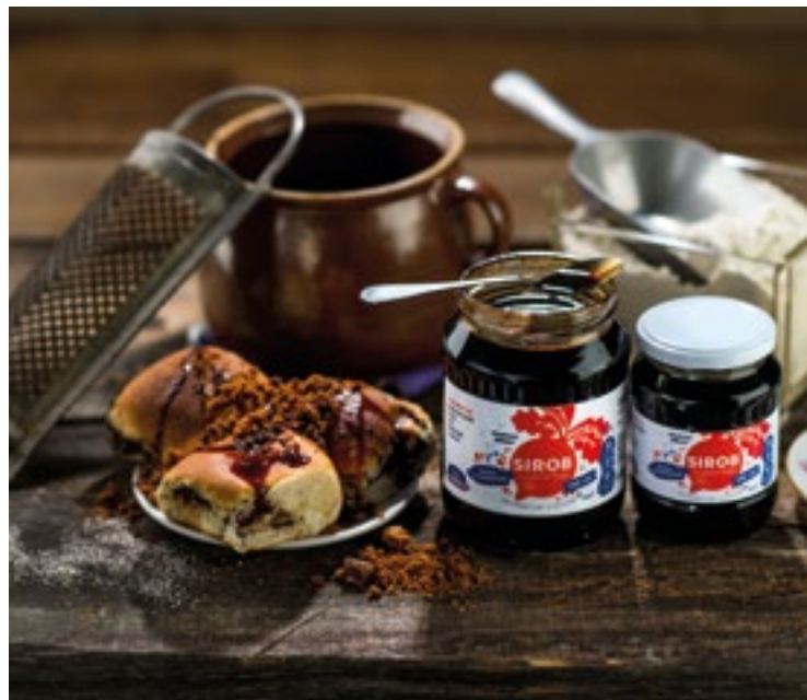
▪ Sirob z Minicukrovaru Mžany je také jedním z regionálních produktů.