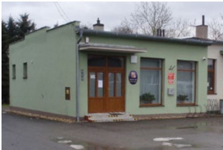
▪ Zrekonstruovaná budova obecního úřadu, dříve prodejna potravin.