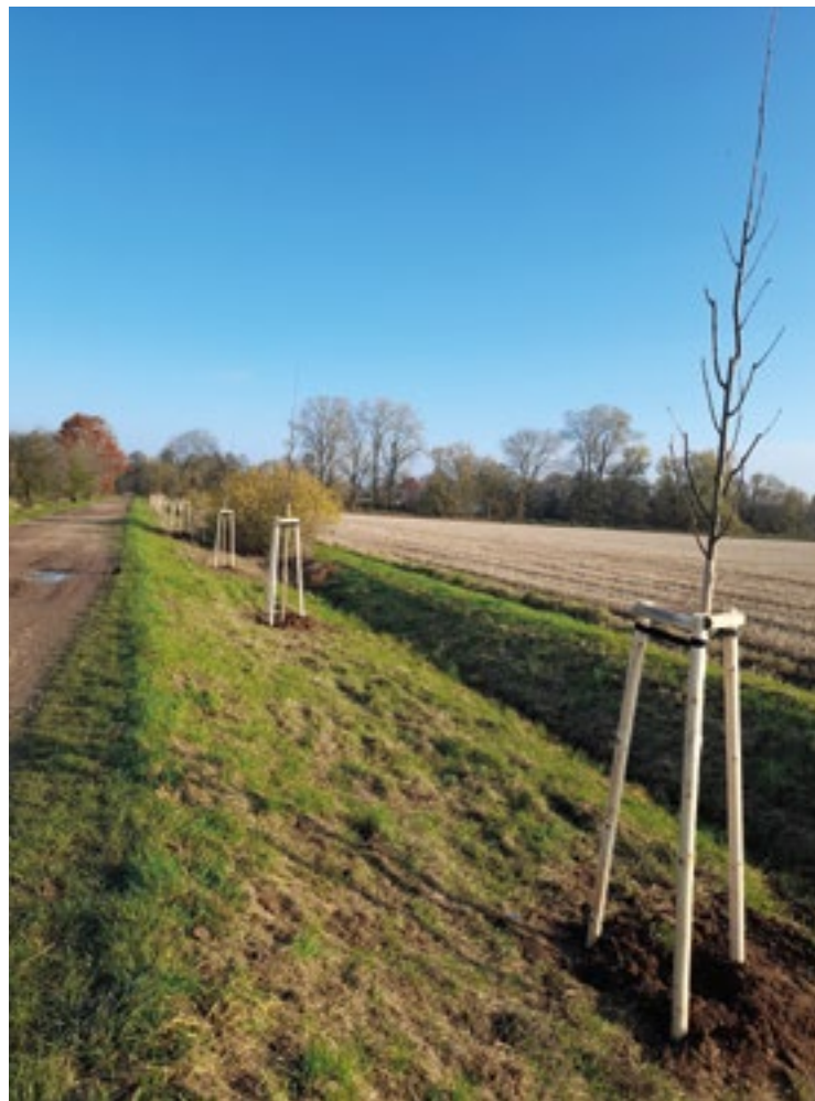
Polní cesta v Mokrovousích je osázena ovocnými stromy.