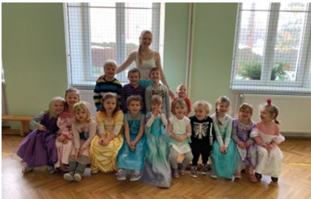
Školka se na týden proměnila v pohádku Ledové království.