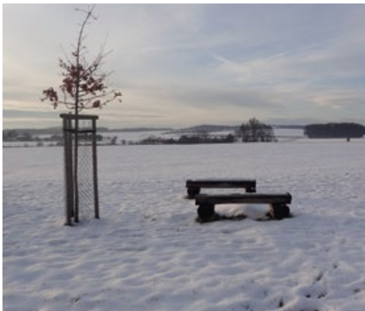
▪ Nové lavičky vznikly z kmenů stromů radíkovského lesa.