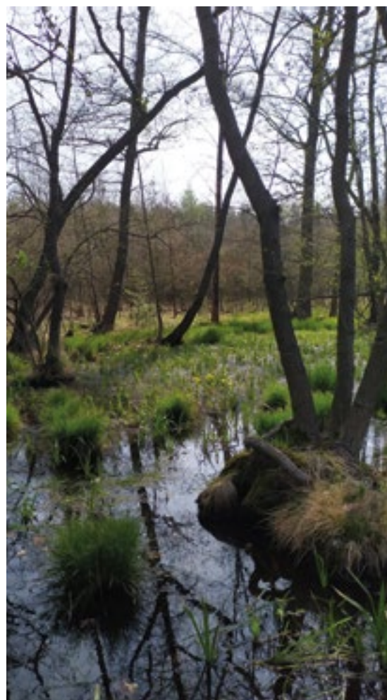
▪ Zimní a letní pohled na těchlovický mokřad.