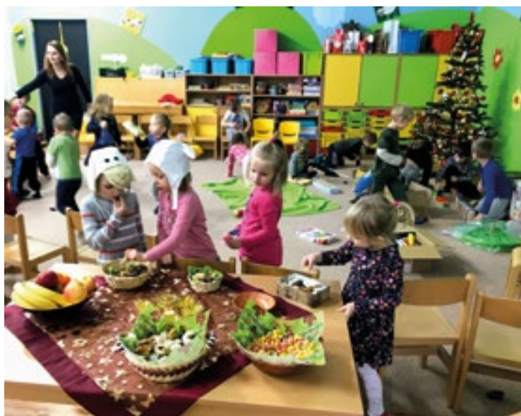
■ Vánoční besídka jsem si všichni moc užili.