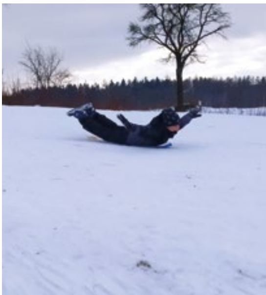
▪ Sníh si děti užívají i u nás.