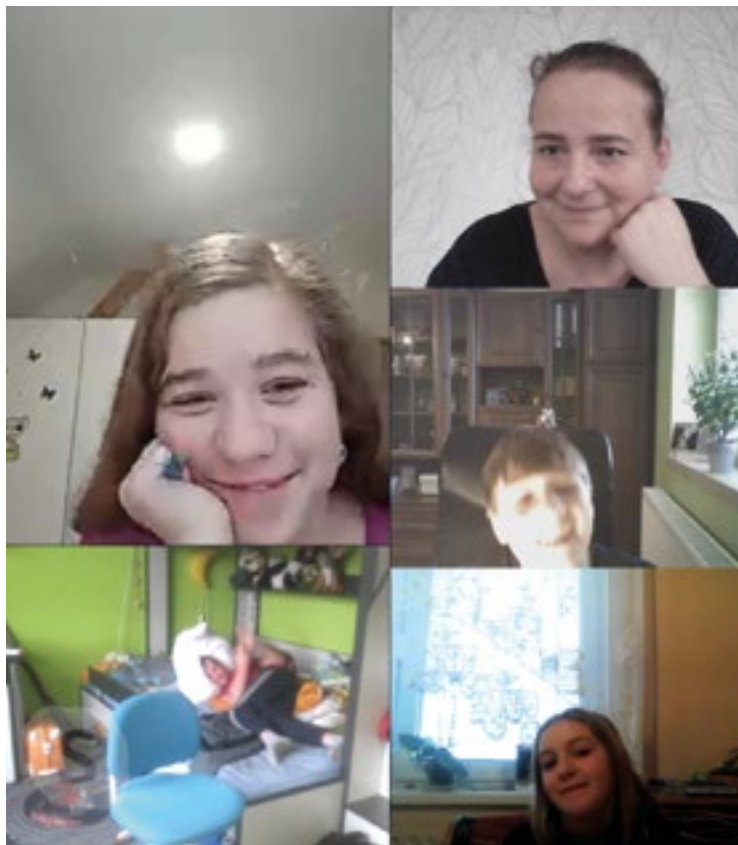
■ Virtuální realita dorazila i do on-line výuky.