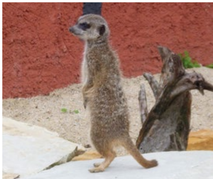
▪ Mezi obyvatele ZOO patří i surikaty.