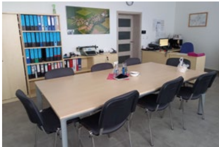
▪ Kancelář obecního úřadu se přestěhovala z nevyhovujících prostor hasičské zbrojnice.