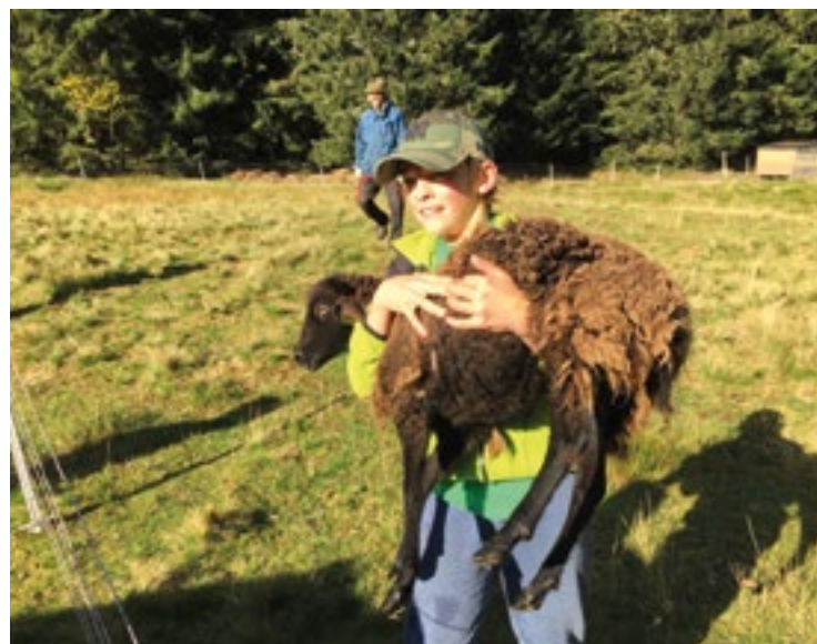
▪ Ovečky se na zimu stěhují do ZOOparku.

Dagmar Smetiprachová, starostka členka lyžařského oddílu TJ Sokol Stěžery